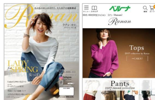
<ラナン 2018 春号>