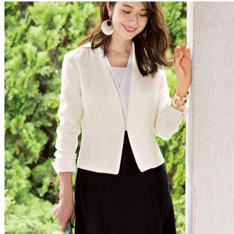
「洗える！白ジャケットエレガントスーツ」 〈12,900円～ 税別〉

ラナンでは新作のスーツを毎シーズン販売しており、そのファッション性やストレッチなどの着心地だけでなく、サイズの豊富さが特長です。自宅で“洗える”スーツも販売しており、お客さまの支持を受けています。