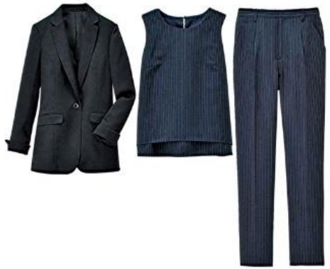
〈ネイビー系セット〉