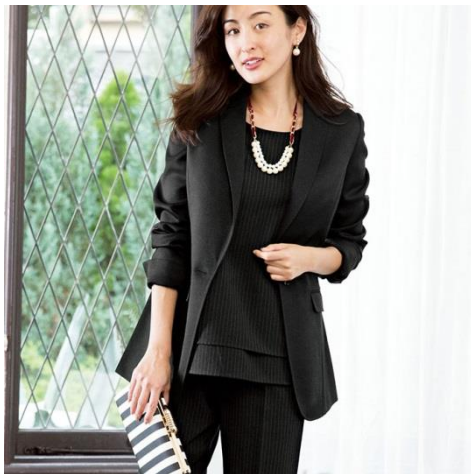
「洗える！ストライプセットアップ3点スーツ」 〈14,900円～ 税別〉

株式会社ベルーナ(本社:埼玉県上尾市/代表:安野 清)が展開する30～40代の女性向けファッション通販「Ranan(ラナン)」( http://belluna.jp/02/010101/shop/ranan/index/ )は、フォーマルでありながら普段着のように自宅でお手入れのできる、洗えるスーツを2018年1月4日(木)より販売開始します。