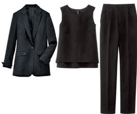
〈ブラック系セット〉