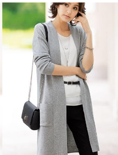
<カーディガン>3,990 円～(税別)

冷たい風の吹く時期は、普段肌トラブルを抱えていない人でも乾燥により刺激に敏感な肌状態となります。衣服による「チクチク」「かゆい」を防ぐには、「肌にやさしい天然素材」「ほどよいゆとりのあるシルエット」「自宅でのお手入れができる」という3つのポイントを備えているかが重要となります。