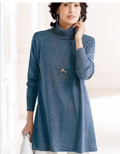
<チュニック>2,990 円～(税別)