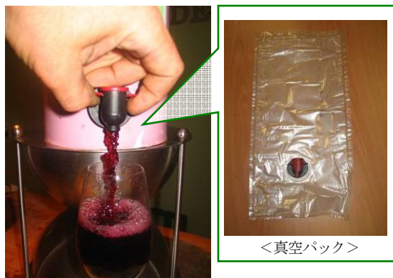
※商品によって注ぎ口や真空パックの形状は多少異なります。

ボックスワインは、紙製の箱に、ワインの入った真空パックがおさめられた形状となっています。真空パックには注ぎ口がついており、箱から注ぎ口を出してセットするだけなので、ワインオープナーは一切不要です。飲み終わった後は、紙箱を折りたたんでコンパクトにでき、真空パックとの分別も容易です。しかも軽量なので、ゴミ出しも楽に出来ます。