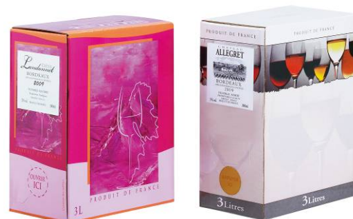
<左: シャトー・ランドネ' 08、右: シャトー・アレグレ' 09>